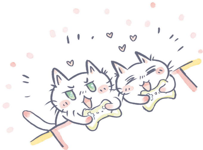
La casa, la famiglia e i giovani

Quest'espressione si usa in genere praticamente da sola, perlopiù quando si vuole esprimere gratitudine verso un amico che ci ha aiutato: yappari motsubeki mono wa tomodachi da yo ne! , È proprio vero che quel che serve nella vita è un amico ...o se preferisci "È proprio vero che chi trova un amico trova un tesoro".