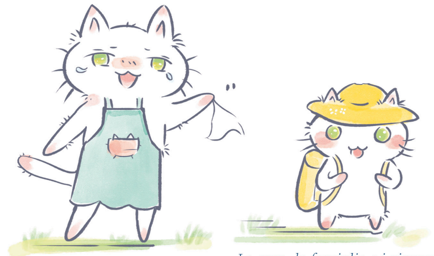
La casa, la famiglia e i giovani

Ho preso alla lettera il detto "Fa' viaggiare il figlio che tanto ami" e ho mandato mio figlio a studiare all'estero.